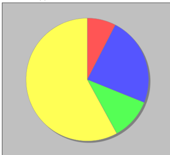
Distribuzione dei docenti a T.I. per anzianità nel ruolo di appartenenza (riferita all'ultimo ruolo)